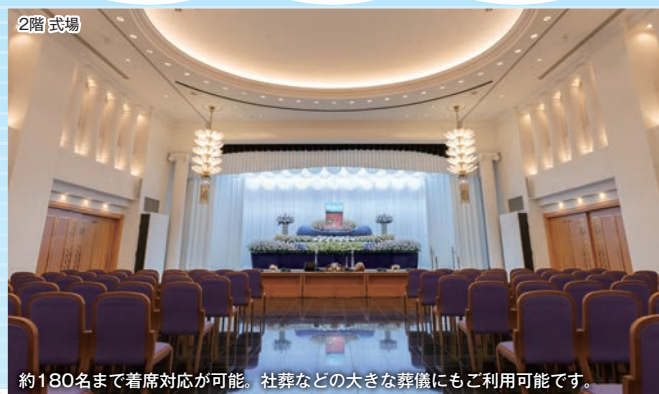
約180名まで着席対応が可能。社葬などの大きな葬儀にもご利用可能です。