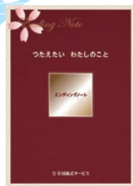
エンディングノート