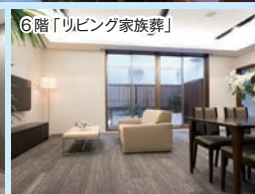
6階「リビング家族葬」