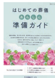
はじめての葬儀 あんしん準備ガイド