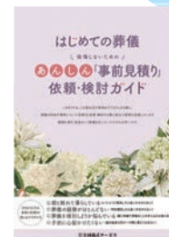
あんしん「事前見積り」 依頼・検討ガイド