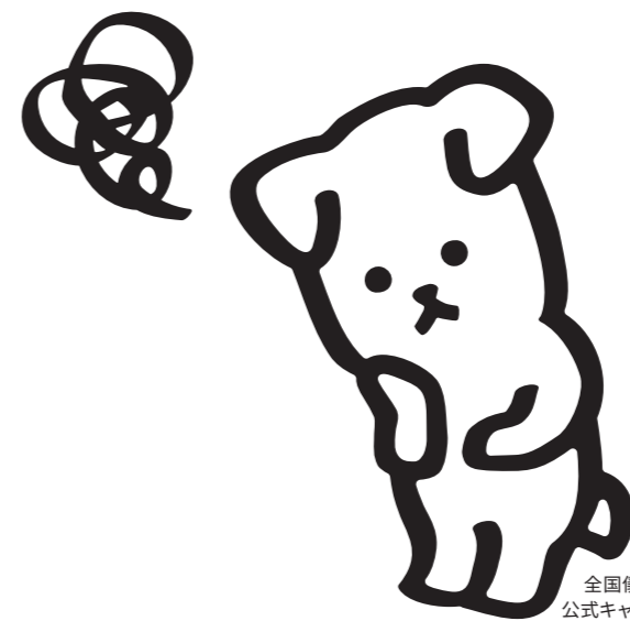
全国儀式サービス 公式キャラクター「しろ」