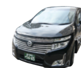
寝台車 車庫から10kmまで