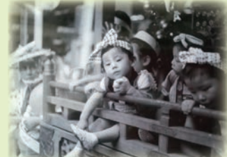
写真は、もらったお饅頭を握りしめ、このまま寝落ちする5分前の私

この会報がお手元に届く頃、私の育った横浜市伊勢佐木町周辺は、お祭り囃子に包まれます。伊勢佐木町商店街は、総鎮守お三の宮日枝神社さんの参道のようになっており、その周辺60町内会がお神輿、山車で練り歩きます。最終日は、伊勢佐木町商店街をお三宮様まで、お神輿50基以上が並び、人々の熱気とで、それは、それは、壮観です。祭囃子が聞こえてくると、うずうずし、新しい足袋やお祭りの支度をしてもらうのがうれしかったのを思い出します。今年は、色々な影響でお祭り開催が難しいと思いますが、令和5年の350周年記念には、開催できることを、そして全国のお祭りが再開できますよう祈っています。お近くに行かれた時は、美味しいお煎餅屋さんがありますので、お煎餅好きな方は、ぜひお試しください。