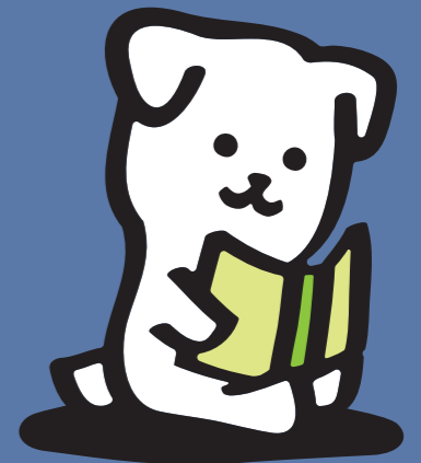
全国儀式サービス 公式キャラクター「しろ」