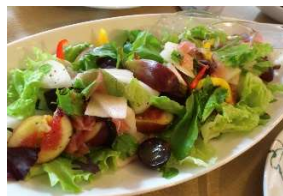
横浜野菜と フルーツのサラダ