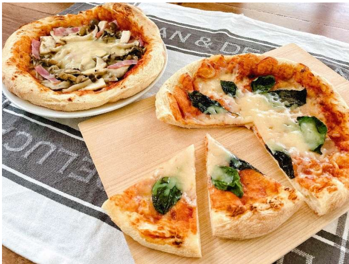
ピザマルゲリータとキノコとベーコンのピザ2種類