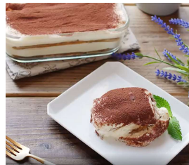
デザートはティラミス