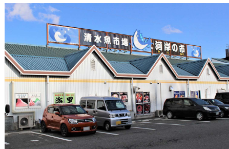
↑ 魚の仲卸業者が集結、鮮魚や干物のお土産を