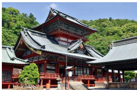
↑ 静岡浅間神社のお参り・御朱印も