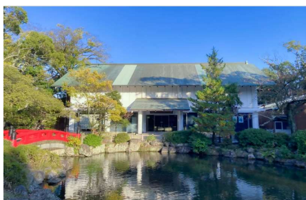
↑ どうする家康 静岡 大河ドラマ館の外観