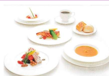
↑ ランチ写真は一例です（パンフより）