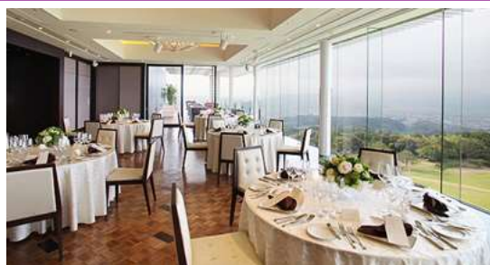
↑ 日本平ホテル・6階レストランでランチ